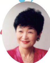
【音楽監督】 松本 真理子

音楽監督: 松本真理子 音楽監督補: 大江可奈子 振付指導者: HIRO 司会者: 佐々木ひろみ