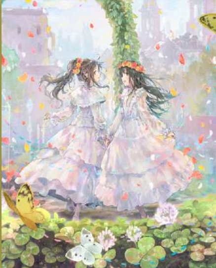
女性2人組ユニット ClariS

クララとカレンの2人組女性音楽ユニット。「魔法少女まどか☆マギカ」や「はたらく細胞」、「リコリスリコイル」など、数々のアニメソングを手がけ、今年デビュー13周年を迎える。