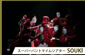
スーパーパントマイムシアター SOUKI