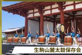
生駒山麓太鼓保存会