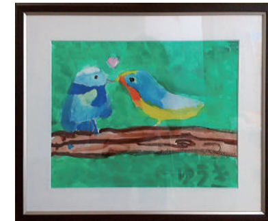
「♥なかよしな鳥♥」土井優季 奈良信用金庫 奈良支店