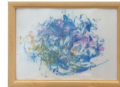
「あじさい」西尾友喜 奈良信用金庫 本店営業部