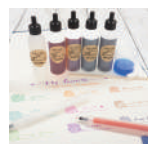
からっぽペン(呉竹)

奈良ゆかりのメーカーが手がける「からっぽペン(呉竹)」・「筆ペン(中川政七商店)」の2種類から、抽選で50名様にプレゼント。みんなのイベントに参加したら、アンケートに答えてGETしよう!