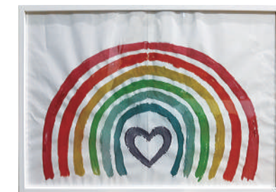
「楽しく作った虹」にじいろ 大和信用金庫 本店営業部